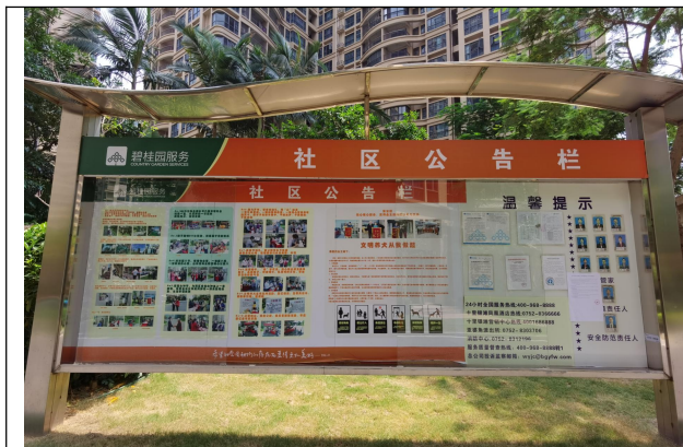
十里银滩山林海小区